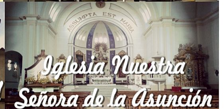
Iglesia Nuestra Señora de la Asunción