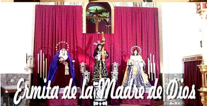
Ermita de la Madre de Dios