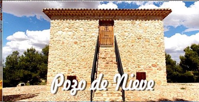
Pozo de Nieve