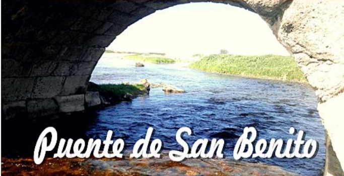
Puente de San Benito