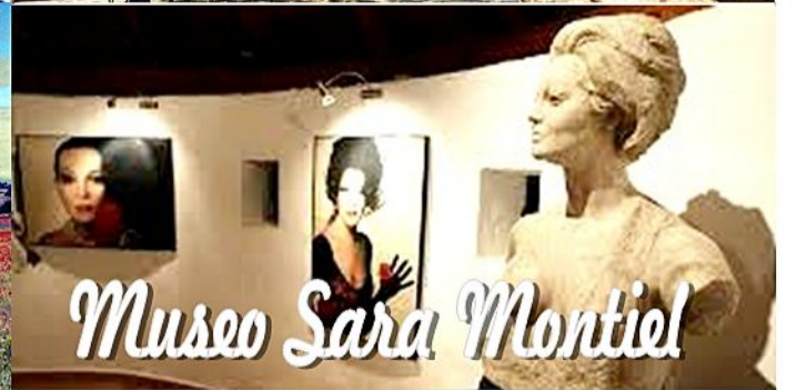
Museo Sara Montiel