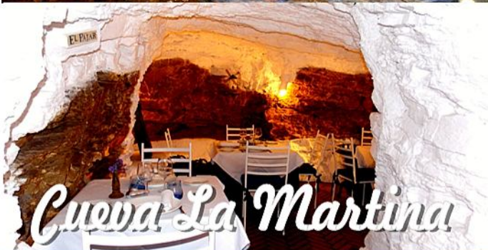
Cueva La Martina