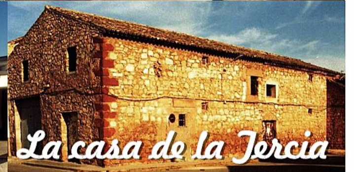
La casa de la Jercia