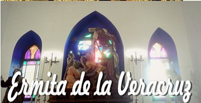
Ermita de la Vera Cruz