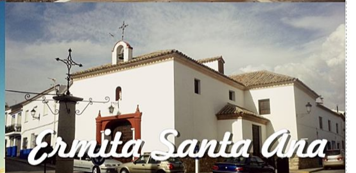
Ermita Santa Ana