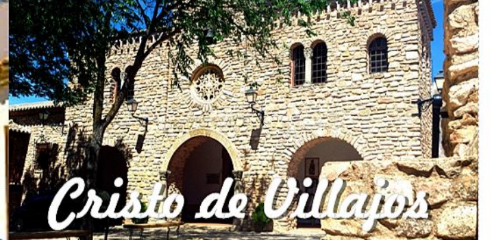
Cristo de Villajos