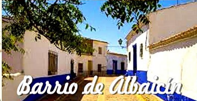
Barrio de Albaicín