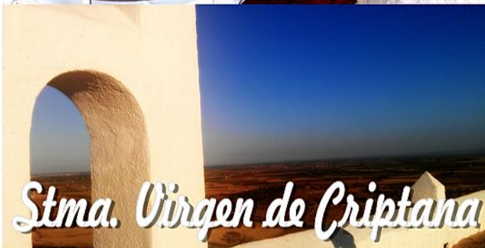
Stma. Virgen de Criptana