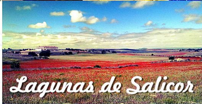
Lagunas de Salicor