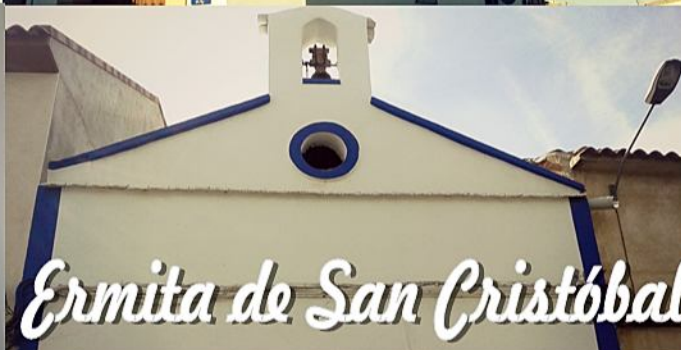
Ermita de San Cristóbal