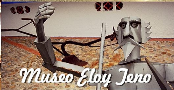
Museo Eloy Jeno