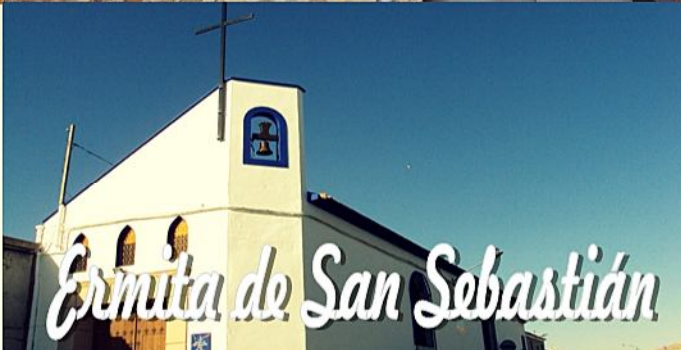
Ermita de San Sebastián