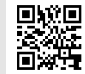
Museo del Pósito