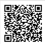
Ermita de la Madre de Dios