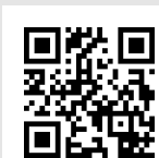
Ermita de la Veracruz