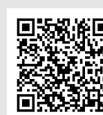
Iglesia de la Asunción