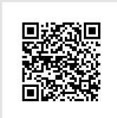
Pozo de la Nieve